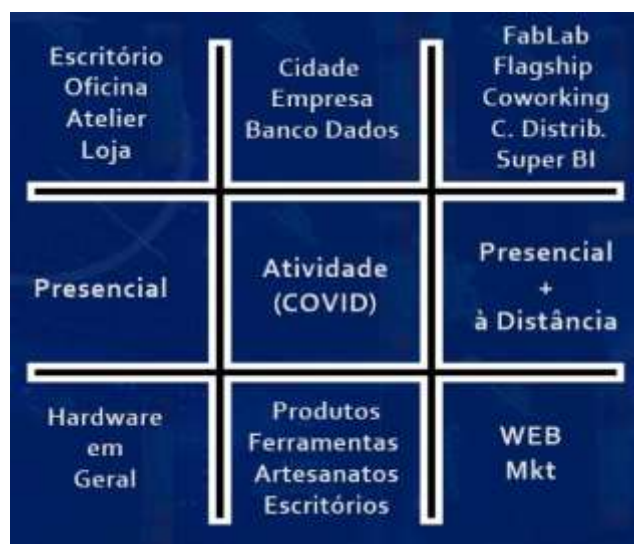
Um possível futuro

Voltando à posição 7 , olhamos para cima para descobrir o que construiremos e onde estaremos imersos. Para esse supersistema do futuro dou o derradeiro 9 . Olhando meu presente e meu passado, posso inferir algumas coisas: (i) os que possuem ofícios únicos, sempre sobreviveram; (ii) sempre tivemos oficinas; (iii) o “povo” gosta de pegar, sentir as coisas; (iv) gostamos de exclusividade; (v) interação, mais do que nunca, é imprescindível. Desprezamos isto quando tínhamos. Estamos, incrivelmente, voltando para o mundo de nossos avós, em que as coisas vão ter que respeitar um paradoxo interessante: serem customizáveis e escaláveis ao mesmo tempo. Assim, para quadrícula 9 , vamos precisar de FabLab 's alugados por uso/hora para produzir artefatos próprios para cada CPF. Para isso acontecer, teremos que escalar as máquinas e não os produtos. Necessitaremos de flagship stores para testar/provar coisas customizadas. De coworkings para interagir e centros de distribuição para entregar todo tipo de coisa, as quais serão abastecidos por grandes lojas. A logística para gerenciar tudo isto precisará de um super BI . Não teremos mais limitação geográfica. Observe que a WEB será lei!